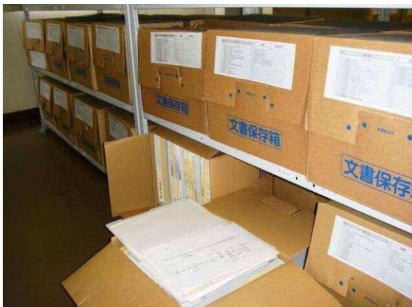
何箱もある高瀬町史編纂資料