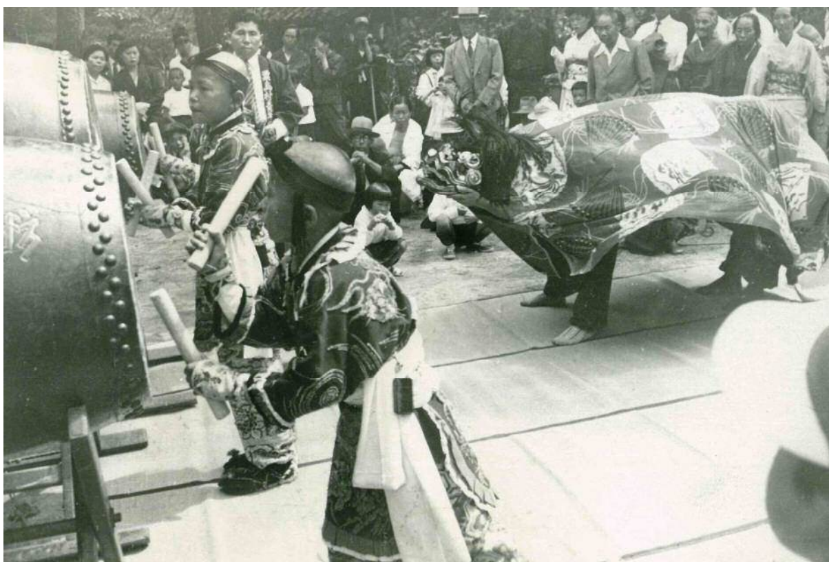
粟島の獅子舞（昭和 45・1970 年頃）