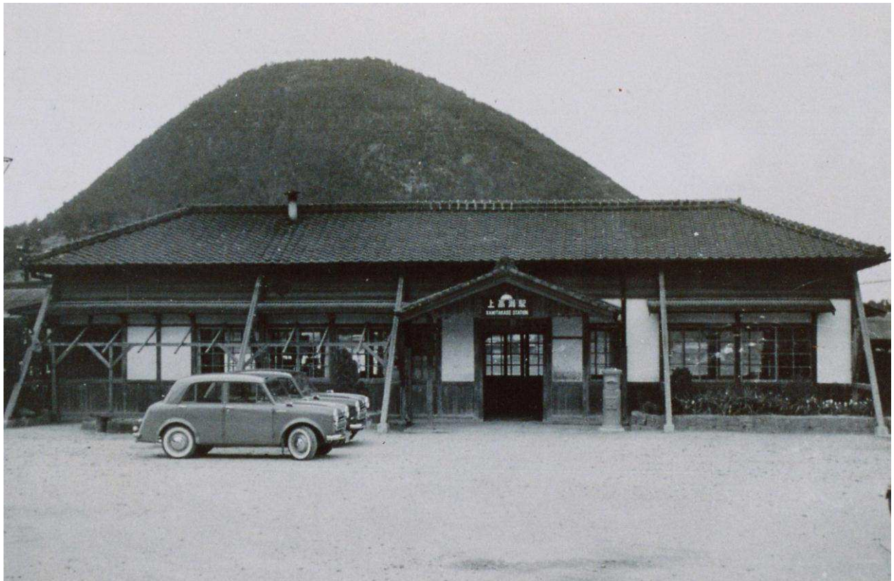
上高瀬駅(現、高瀬駅) 昭和 30(1955)年代