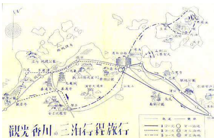
観光香川の三泊行程旅行