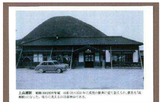
上倉瀬駅 昭和 34(1959)年頃 昭和 31(1956)年に現在の駅舎に建て替えられ、駅名も「高瀬駅」になった。後に見えるのは倉瀬山である。