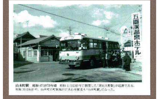
山本町駅 昭和 47(1972)年頃 昭和 11(1936)年に開業した「湯田大野駅」が廃駅である。昭和 33(1958)年、山本町の町制施行にあわせ駅名も「山本町駅」になった。