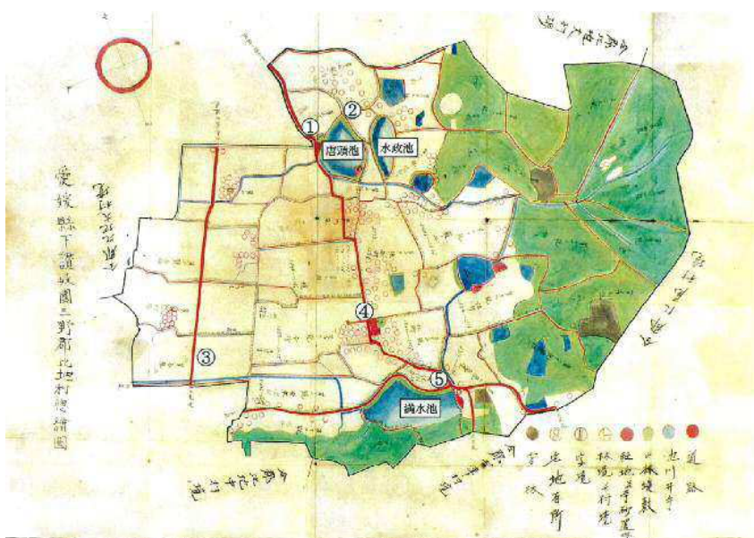
愛媛県下讃岐国三野郡比地村惣絵図

明治20(1887)年頃に作られた29枚からなる「切絵図」をまとめたもの。主要な道路は太い朱線で描かれている。丸亀・高松方面への道は、現在の県道岡本高瀬線である。仁尾・詫間方面への道は、現在の主要地方道豊中三野線ではなく、その西側の旧街道が描かれている。昭和47(1972)年撮影の航空写真にも、豊中三野線は描かれていない。